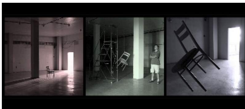
Marcel Kurucz: Foto z natáčení